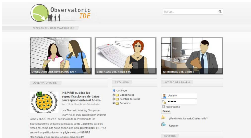
Figura 1. Aspecto parcial de la portada del portal Observatorio IDE

La estructura del portal se centraliza en una portada desde cuyos menús se puede acceder a cualquier contenido o herramienta concreta. Además, muestra una síntesis personalizada de información a través de la declaración de registro: últimas noticias y artículos, eventos próximos, avisos de mensajería interna, etc.