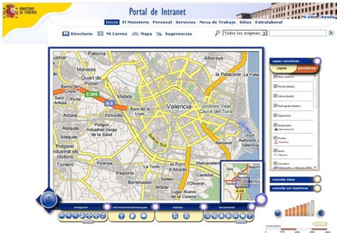
Figura 2: Geoportal del Ministerio de Fomento