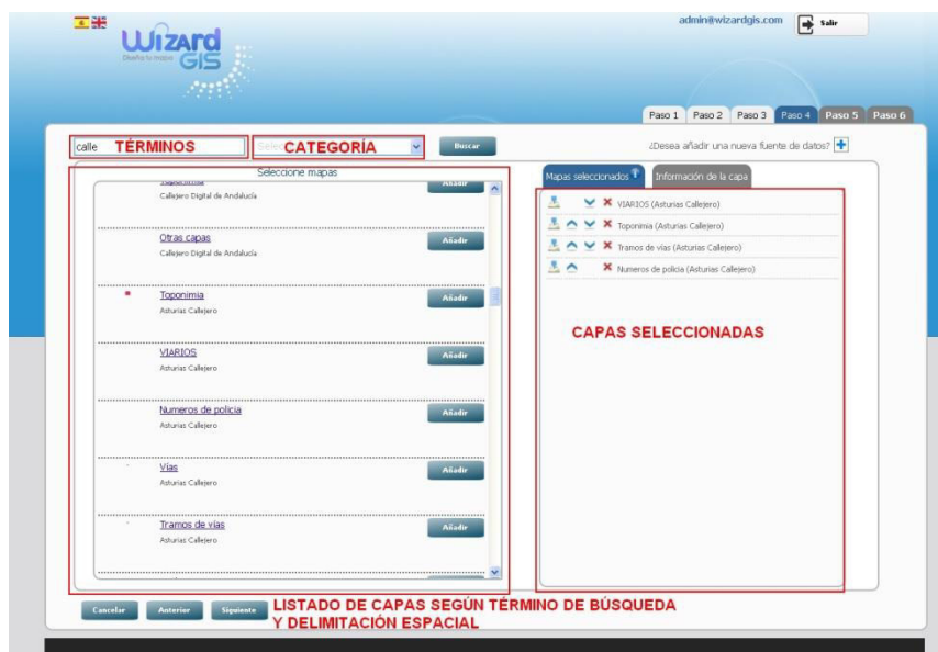
Figura 2: Paso 4 de WizardGIS. Selección de capas a incorporar en el mapa. Utilización del servicio de catálogo descrito en el artículo.

A partir del software planteado, se ha creado la aplicación WizardGIS [8], un sistema que permite crear visores personalizados con una cartografía base. Esto se realiza basándose en servicios proporcionados por Google, Bing, OpenStreetMap y muchos otros, así como cualquier servicio Web de mapas (WMS) disponible en Internet. El usuario no tiene necesidad de conocer las direcciones URL de los servicios WMS que desea incorporar a su mapa. Realizando una consulta mediante una herramienta estándar de búsqueda, selecciona de un listado de capas, las más adecuadas para incorporar al visor de mapas que está creando. WizardGIS es una herramienta muy sencilla y útil para crear y publicar visores de mapas temáticos (estudios urbanísticos, medio ambientales, prototipos, impactos, callejeros, etc.). En su primera versión se encontró con la dificultad de ofertar un servicio de catálogo de capas eficiente que facilitase a cualquier usuario, experto en SIG o no, construir su visor de mapas. El sistema de catálogo planteado pretende solventar esa dificultad. WizardGIS es una alternativa a GeoNode [9], una plataforma para compartir datos y mapas. Ambas nacen con la misma filosofía, con la ventaja que WizardGIS permite realizar búsquedas acotadas a nivel espacial y definir el tipo de proyección, algo muy interesante para entornos profesionales.