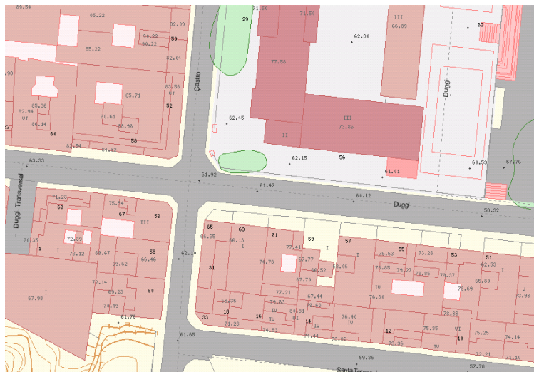
Servicio WMS de Mapa Topográfico 1:1.000