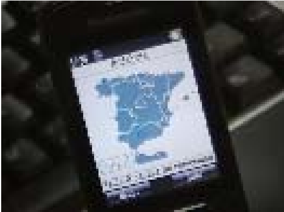
Figura1 . Pantalla de visualización del mapa de orientación general en un móvil.

MAPAMOVIL tiene como objetivo presentar el Mapa Topográfico Nacional a escala 1:25.000 (MTN25) del Centro Nacional de Información Geográfica (CNIG) en un teléfono o dispositivo móvil que disponga de una vía de comunicación con Internet a través de un navegador web. Precisaré de una máquina virtual Java con perfil MIDP 2.0 para la correcta ejecución del visor de mapas.