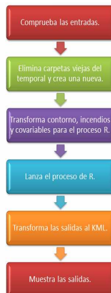
Figura 2. Principales pasos del WPS

El primer paso, ya dentro de nuestro algoritmo, es comprobar que todas las entradas son correctas. Para no tener más problemas de incompatibilidad de momento todas las entradas son obligatorias.