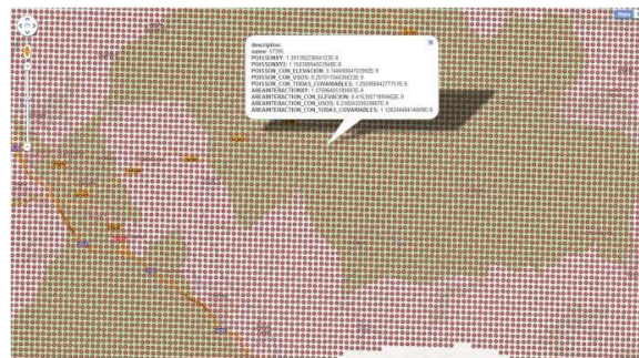
Figura 3. Representación visual del contenido de un punto del KML

EL WPS genera dos salidas, una el KML con la predicción de riesgo y las gráficas para cada modelo. El KML generado tiene para cada punto asociado un extendedData con los valores para cada uno de los modelos en que se ha ejecutado el proceso (Figura 3).