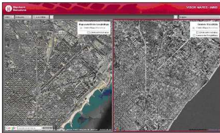
Figura 1. Visor de mapas WMS

Entre ellos, disponemos de diferentes visores de servicios estándares WMS, guías referidas a callejeros municipales y también herramientas SIG por Internet. En este último grupo destacamos la nueva versión de SITMUN (proyecto desarrollado en colaboración con diferentes administraciones públicas, en cumplimiento de la Ley 37/2007 sobre la reutilización de la información del sector público).