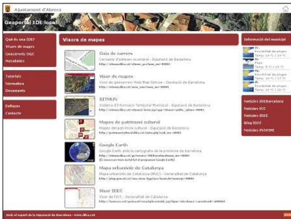
Figura 4. Geoportal IDE local de Aberra (visores)

Por ello, continuando en la línea de soporte municipal que ofrecemos desde la Diputación de Barcelona, hemos apostado por el desarrollo de un proyecto que facilite la implantación de geoportales IDE local para los ayuntamientos de la provincia con pocos recursos. Se trata de la elaboración de geoportales muy completos ya que no se limitan simplemente a disponer de un visor, sino que incluyen otras herramientas verdaderamente útiles y prácticas para el ciudadano de a pie.