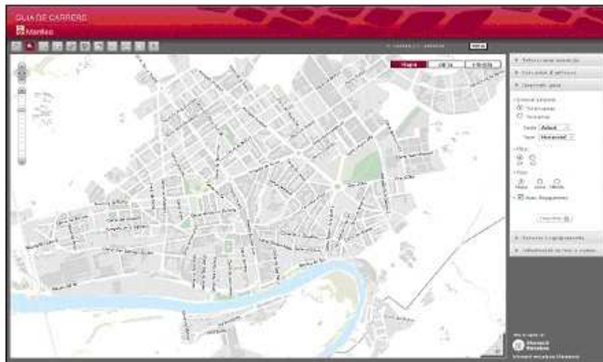
Figura 3. Callejero municipal