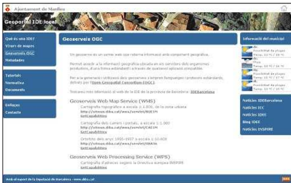
Figura 5. Geoportals IDE local de Manlleu (geoserveis)

El principal objetivo de esta iniciativa es el de ofrecer a los ayuntamientos un nuevo servicio, que les permita disponer de un punto de entrada a todos los recursos relacionados con la IDE y la información geográfica disponible, entre los que destacan los que ofrece la propia Diputación. Dicho servicio pretende facilitarles el cumplimiento de la legislación vigente en este ámbito.