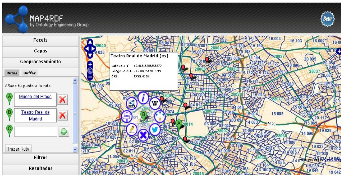
Figura 4. Visualización de map4RDF y sus funcionalidades

Adicionalmente, pensando en la usabilidad de la aplicación y en que el usuario de la misma pudiera interactuar con todas las funcionalidades añadidas a map4RDF de una manera directa, se ha implementado una funcionalidad que permite desplegarlas en torno al POI seleccionado por el usuario. Un ejemplo del resumen de las funcionalidades implementadas se muestra en la Figura 4. De esta manera, el usuario tiene un fácil acceso a la información relevante de un POI, ya que a través de este resumen se puede acceder a las diferentes funcionalidades implementadas. Todas las funcionalidades de map4RDF descritas con anterioridad se encuentran desplegadas en el sitio web de GeoLinked Data ( http://geo.linkeddata.es ).