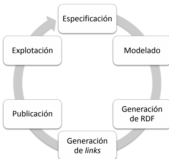
Figura 1. Actividades de la metodología para la generación y publicación de Linked Data

Figura 1 muestra una visión general de las actividades que recoge la metodología propuesta.